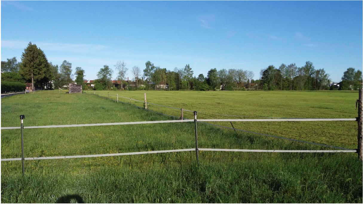
Blick von Osten her auf das neue Wohnbaugebiet