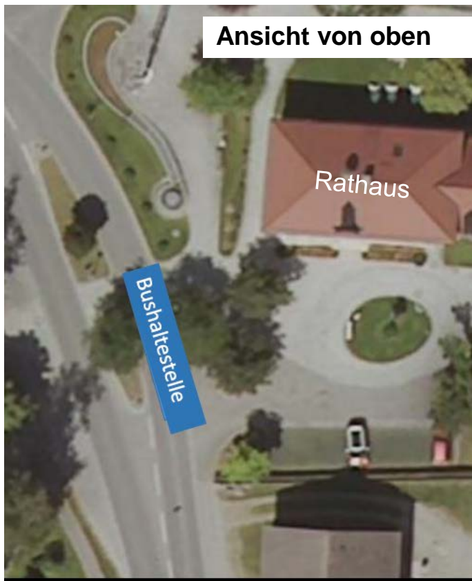
Ansicht von oben

Die Gemeinde Wiedergeltingen hat dort neue Fahrradständer bereitgestellt. Darüber hinaus soll ein weiteres Buswartehaus im Parkplatzbereich des Rathauses aufgestellt werden.