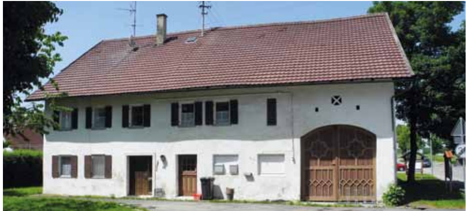
Aurbacherhaus – hier soll das Dorfgemeinschaftshaus entstehen mit einer direkten baulichen Anbindung an die Grundschule; eine gemeinsame Küche soll dann einerseits für Veranstaltungen im Dorfgemeinschaftshaus genutzt werden und andererseits auch für die ab 2026 gesetzlich vorgeschriebene Ganztagesbetreuung in der Grundschule

Nach Auswertung der Punktevergabe konnte sich das Büro Daurer+Hasse aus Wiedergeltingen mit deutlichem Vorsprung gegenüber dem Mitbewerber durchsetzen. Hochbautechnisch, z. B. in Bezug auf die ersten Planungsansätze für ein Dorfgemeinschaftshaus oder auch das Thema „Wohnkonzepte“, wird das Büro Daurer+Hasse durch das Architekturbüro Roland Rieger aus Mickhausen unterstützt.