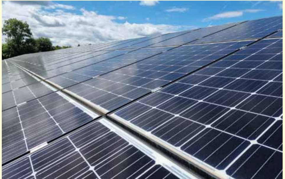
PV-Freiflächenanlage in Gersthofen

Falls Sie Eigentümer entsprechender Flächen oder Gebäude sind oder Wärme liefern könnten und Interesse hätten, an ein mögliches Regionalwerk zu verpachten, Wärme zu liefern oder sich auch selbst an einer Anlage finanziell zu beteiligen, kommen Sie gerne auf die Gemeindeverwaltung zu. Dann können wir die Möglichkeiten einer Zusammenarbeit in den Geschäftsplanungsprozess einbringen bzw. prüfen.