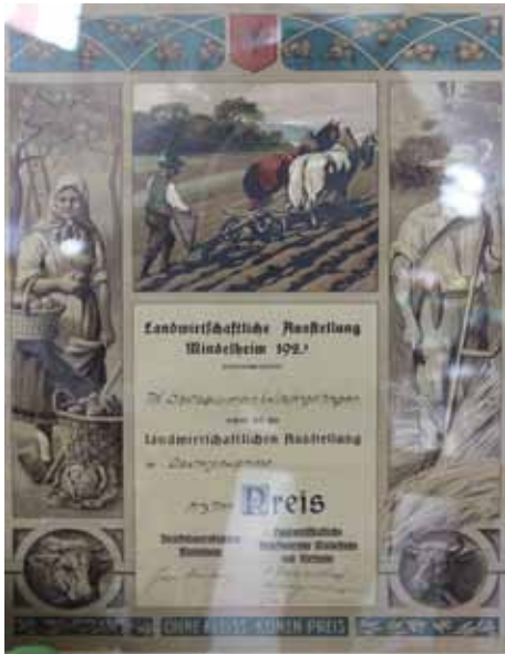
Auszeichnung für den Obstbauverein Wiedergeltingen im Jahr 1923

An den aufgestellten Bilderwänden konnten die Besucher 25 Jahre Gartenfreunde durchwandern.