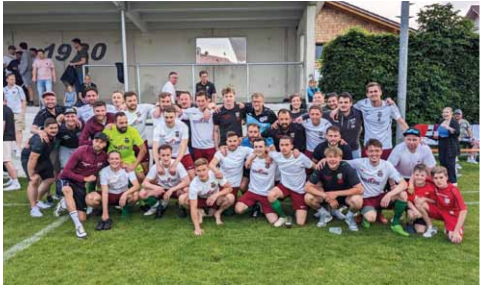
Relegationsspiel in Dirlawang der 1. Mannschaft