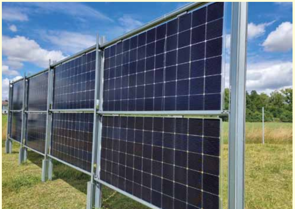
Agri-PV Anlage in Gersthofen