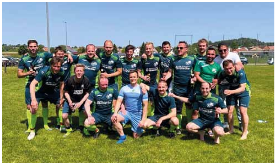
3. Mannschaft wird Meister