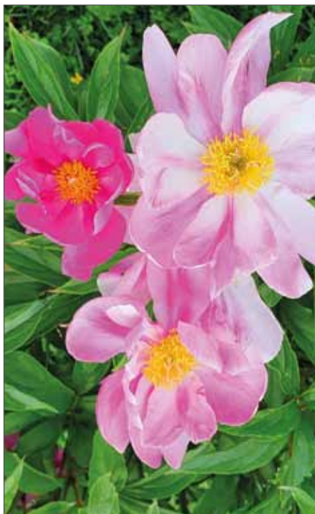
Die Pfingstrosen blühen