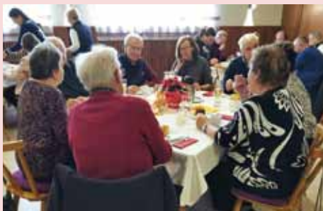
Gut besucht war die AWO-Adventsfeier im Gasthof Rosenbräu in Türkheim