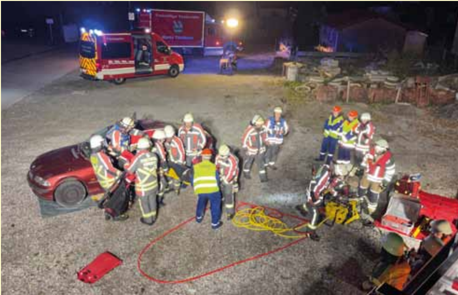
Einsatz 3: Verkehrsunfall