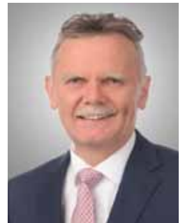
Ihr Norbert Führer Erster Bürgermeister