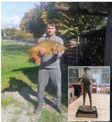
Fischerkönig und der Pokal

MEISTER DER STEINE FÜR BAU, FRIEDHOF, GESTALTUNG IN IHRER NÄHE