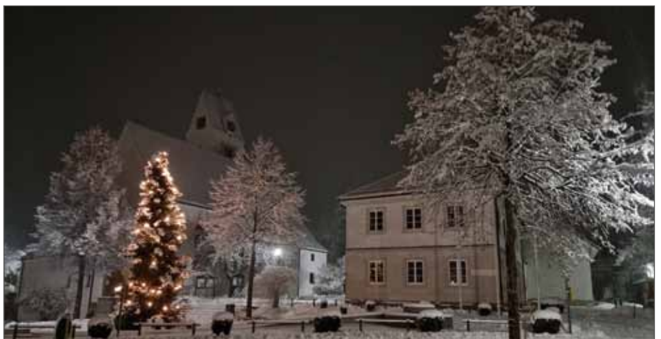
Wiedergeltingen – Winterstimmung am Dorfplatz