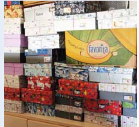
... bei der Sammelstelle Besch abgegeben hat