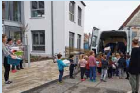
Kita St. Nikolaus Wiedergeltingen