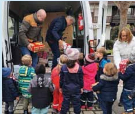
Kita St. Elisabeth, Türkheim

DANKE aber auch an ALLE , die nicht namentlich genannt sind!