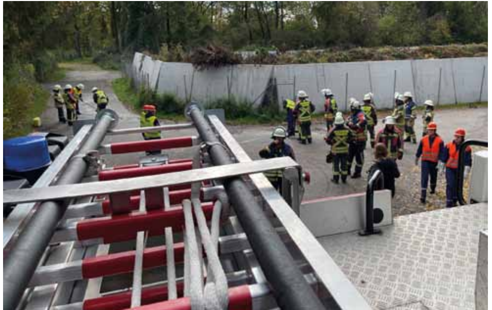
Einsatz 1: Ölspur

Ein gemütlicher Spieleabend wurde dann von einem weiteren Alarm unterbrochen: „ Verkehrsunfall (VU) mit zwei eingeklemmten Personen “. Dieser Einsatz forderte die Kraftreserven des Tages. Mit schwerem Gerät musste das Auto aufgeschnitten werden, um an die Verletzten zu kommen.