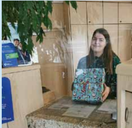
Sammelstelle Raiffeisenbank Wiedergeltingen

Nachstehend ein paar bildliche Eindrücke von der Abholung.