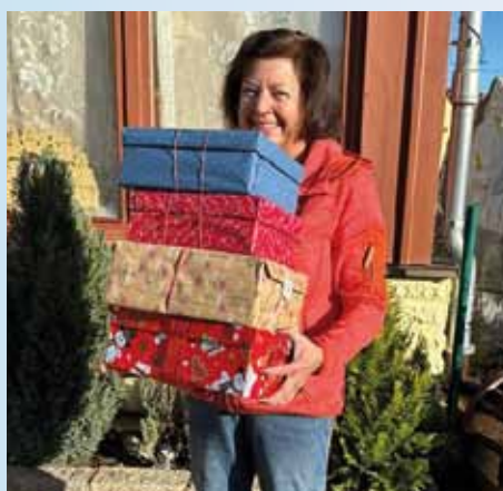
Eine der Spenderinnen, die ihre Päckchen ...