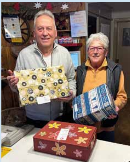
Sammelstelle Bäckerei Seitz, Wiedergeltingen

Wir bedanken uns bei der Bad Wörishofer Tafel und Wiedergeltinger Nudelmanufaktur Wolf , die für die Pakete Lebensmittel beisteuerten.