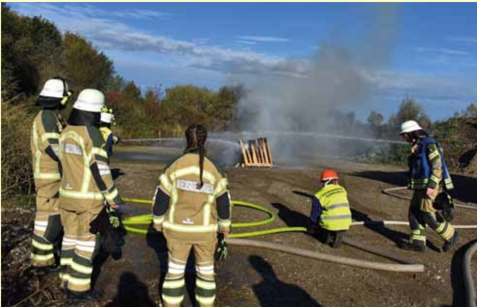
Einsatz 5: Brand im Freien