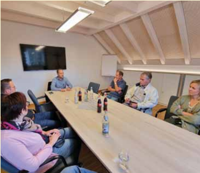
Könghausen: Besprechungsraum im Bürger- und Vereinshaus