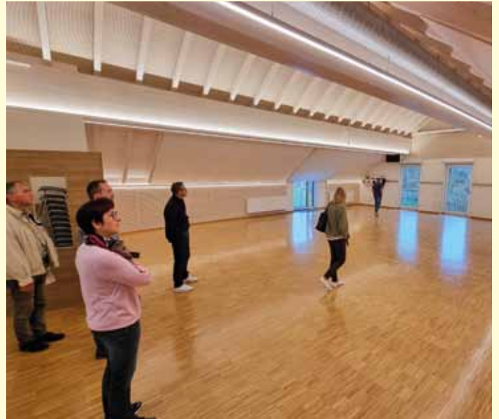
Könghausen: Saal im Bürger- und Vereinshaus