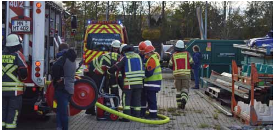
Einsatz 2: Rauchentwicklung